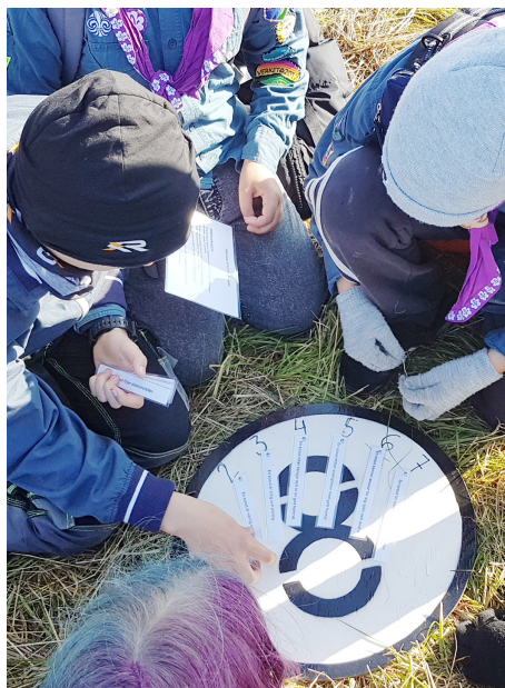
Klurigt på kämpalek.